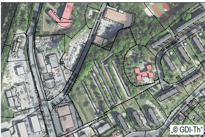
Auszug aus GIS 19.05.2026, ALKIS Stand 09.04.2026 - Umgriff (Teilbereich 2) zur Umsetzung der Kompensationsmaßnahmen; ohne Maßstab; Entwurf

Der Teilbereich 2 des Geltungsbereiches umfasst etwa 2 ha und betrifft das Flurstück 4067/2 der Gemarkung Meiningen. Das Flurstück befindet sich im Eigentum der Stadt Meiningen.