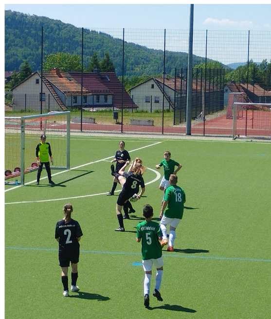
D-Junioren-Spiel in Zella-Mehlis gegen die WSG Zella-Mehlis II (11. Juni 2023)