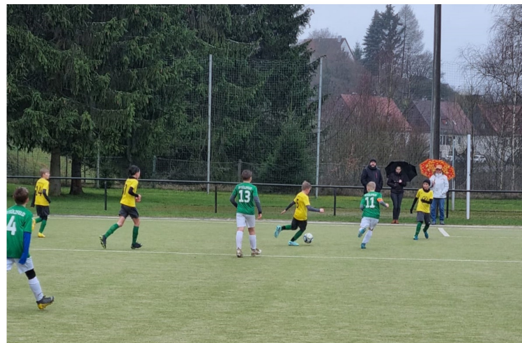
Zur Abkühlung in diesem Sommer: Foto vom Regenspiel der E-Junioren-Spiel in Suhl (Pokalspiel gegen Dietzhausen am 1. April 2023)