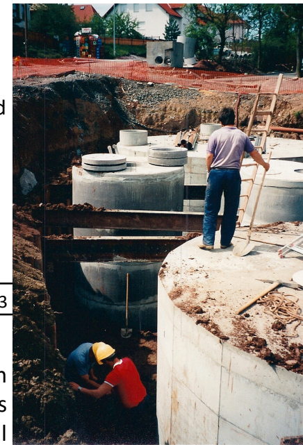
Bau der Kläranlage am Kindergarten - ca. 1992

Unserem Heimat- und Trachtenverein wurde von der VR-Bank Main Rhön, vertreten durch Herrn Suckfüll, eine Spende in Höhe von 1.000 € überreicht. Das war für die Mitglieder eine große und freudige Überraschung.