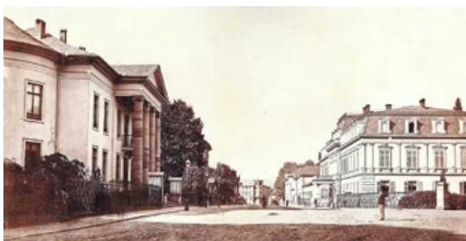
Bernhardstraße mit kleinem Palais und großem Palais, um 1900