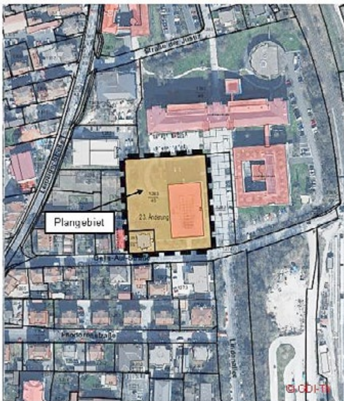
Plangebiet BP-Nr.: 2 „Hauptkaserne“, 3. Änderung der Stadt Meiningen; ohne Maßstab