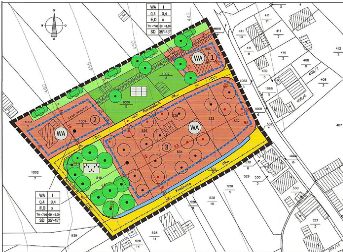
Geltungsbereich Bebauungsplan WA „Kniebreche“ der Stadt Meiningen OT Stepfershausen; ohne Maßstab

des Bebauungsplanes ist in nachstehendem Kartenausschnitt dargestellt.