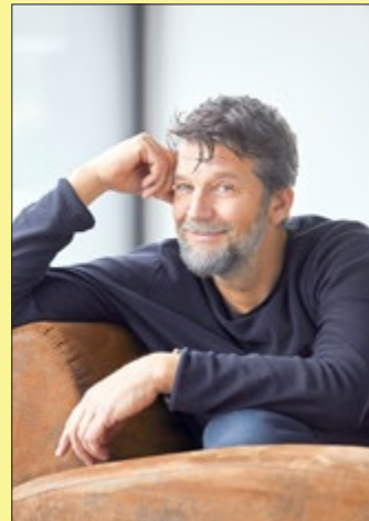
Kai Wiesinger

Liebe ist das, was den ganzen Scheiß zusammenhält Der bekannte Schauspieler erzählt Familiengeschichten. Familie ist nichts für Weicheier