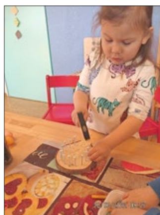
Werkeln für den Osterhasen

Den Plätzchengeschmack hat er mit seiner feinen Nase sicherlich auch wahrgenommen. Denn in der oberen Etage haben die Kinder mit Begeisterung Teig geknetet, Ostereier, Möhren und