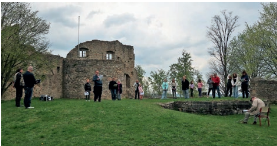
Auf der Henneburg wird nun jedes Wochenende geprobt. Besucher, die zuschauen und verweilen möchten, sind herzlich willkommen.