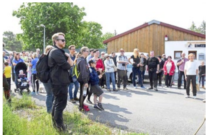
Eröffnung Tiererlebnistag 2019