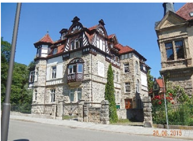
Mittlerer Rasen 7