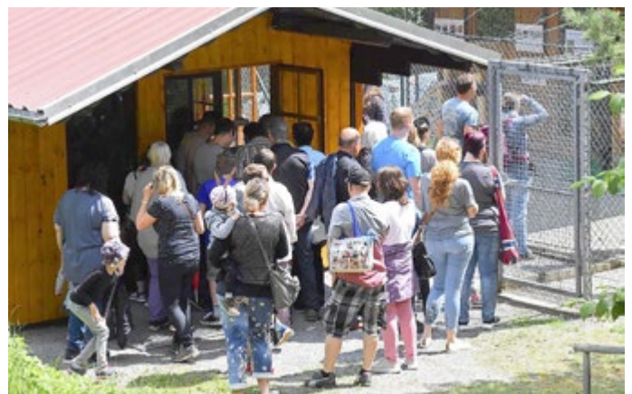
Tiererlebnistag 2019 - Andrang am Katzenhaus

Die Meininger Tiervereine hoffen auf viele interessierte Besucher!