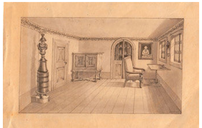
Museumsabend Schiller, Schellhorn, Schillerstube Bauerbach 1861