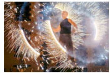
Meiningen leuchtet 2018, Feuer-show im Meiningener Schlosshof, Foto: Michael Reichel, Ilmenau

Als Einstimmung auf die dunklere Hälfte des Jahres veranstalten Kultureinrichtungen, Gewerbetreibende, Vereine und Schulen auch 2019 in Meiningen ein Lichtfest am letzten Freitag im Oktober. „Meiningen leuchtet“ heißt das Motto in der gesamten