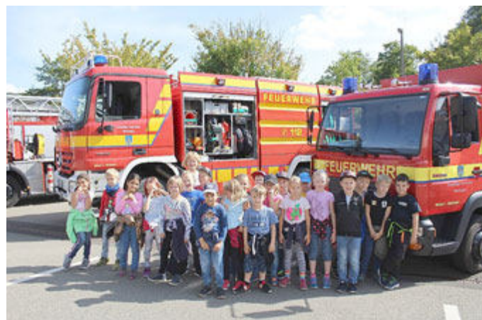
Feuerwehr zum Anfassen gab es am Freitagvormittag für etwa 350 Mädchen und Jungen aus den Schulen und Kindergärten im Meininger Feuerwehrgerätehaus.