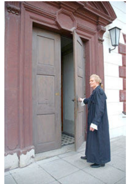
Museumsabend Schiller, Koschinski 2005, Foto: Foto ed

Dr. Andreas Seifert, 03693 502848, a.seifert@meininger-museen.de