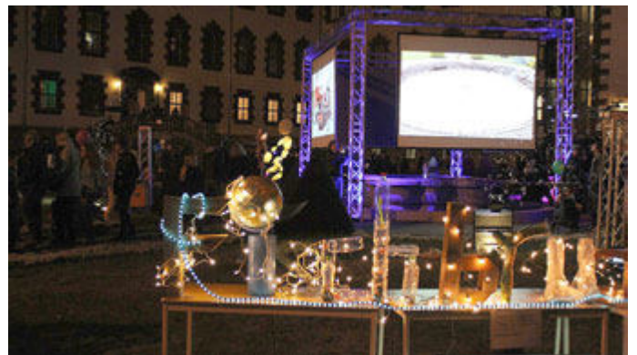
Meiningen leuchtet, Lichtinstallationen von Schülern des Henflinggymnasiums zu Meiningen leuchtet 2018; CR Meiningener Museen, Foto: Axel Wirth

Uta Irmer, 03693 881033, u.irmer@meiningermuseen.de