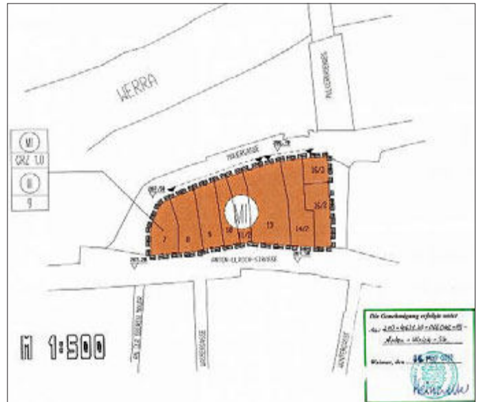
BP-Nr. 27 „Anton-Ulrich-Straße/Pulverrasenweg“ Aufhebungssatzung

Der Stadtrat der Stadt Meiningen hat den Bebauungsplan Nr. 27 „Anton-Ulrich-Straße/Pulverrasenweg“ der Stadt Meiningen am 07.05.2019 (Beschluss-Nr.: 368/52/2019) zur Aufhebung beschlossen. Der aufgehobene Geltungsbereich des Bebauungsplanes ist im nachstehenden Kartenausschnitt dargestellt.