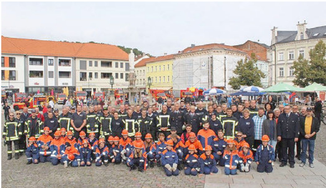
Bürgerpräsens zeigte am Wochenende die sechs Wachen der Meininger Feuerwehr beim 1. Stadt-Feuerwehrtag auf dem Markt. Die Veranstaltung fand nicht nur bei den Bürgern der Kreisstadt, sondern auch bei den zahlreichen Gästen großes Interesse.