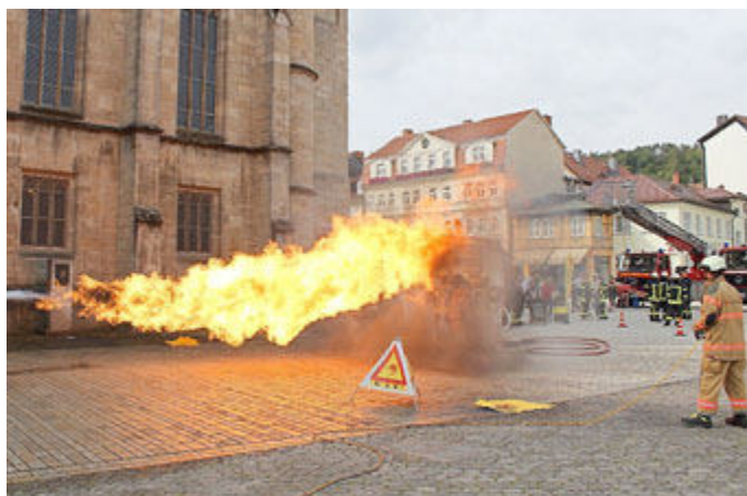
Hautnah erleben konnten die Besucher ein Szenario, das bei einem Gasbrand entsteht. Die Fire Storm-Vorführung war zugleich eine Ausbildungseinheit für die Einsatzkräfte.