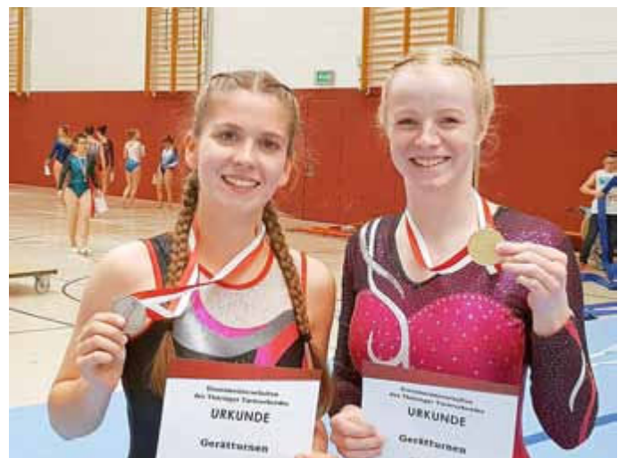
Gold und Silber