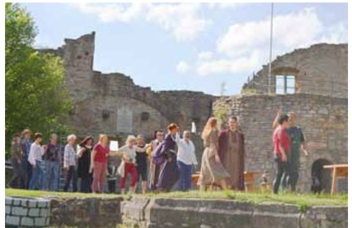
Ein Schreittanz wird mit viel Spaß einstudiert.