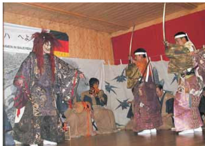
Text und Fotos: Karla Banz

Die weiteste Anreise haben aber auf jeden Fall die Gratulanten, die aus dem Land der aufgehenden Sonne - aus dem etwa 10 000 Kilometer entfernten Asahi-Mura in Japan kommen. Es ist eine Delegation von Mitgliedern des Osuto Noh-Theaters und Kommunalpolitikern der Präfektur Niigata. Mit dem Osuto-Noh-Theater verbindet die Bauerbacher seit 20 Jahren eine Partnerschaft. Zweimal war das Schillertheater auf Gastspielreise in Japan und auch die japanischen Partner besuchten Bauerbach. Fünf Treffen gab es von 2000 bis 2007 insgesamt im Rahmen des Japan-Projektes. Dass diese Begegnungen auch in Japan in guter Erinnerung geblieben sind, zeigte vor eineinhalb Jahren der Besuch von Familie Takahashi in Bauerbach. Sowohl von den Gästen aus Japan als auch von den Bauerbachern wurde bei diesem Treffen der Wunsch geäußert, die Verbindung wieder aufleben zu lassen. Kürzlich nun kam die Zusage, dass eine 12-köpfige Abordnung aus Japan am 3. Juli anreist. Es sind Mitglieder des Noh-Theaters und einige Kommunalpolitiker der Präfektur Niigata. Die Aufführungen der japanischen Theatergruppe am 4. Juli ab 15 Uhr in der Bauerbacher Theaterscheune werden daher ein ganz besonderes Highlight der Jubiläumsfeierlichkeiten sein, die dann am Sonntag, 7. Juli, bei einem Wiedersehen mit Tabaluga und einem Mega-Kinderfest ihren krönenden Abschluss finden.