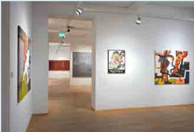
Pinsel Faden Farbe, Foto: Seele

Malerei und Textilkunst im Dialog Gobelins, Gemälde, Wandobjekte bis 18. Februar