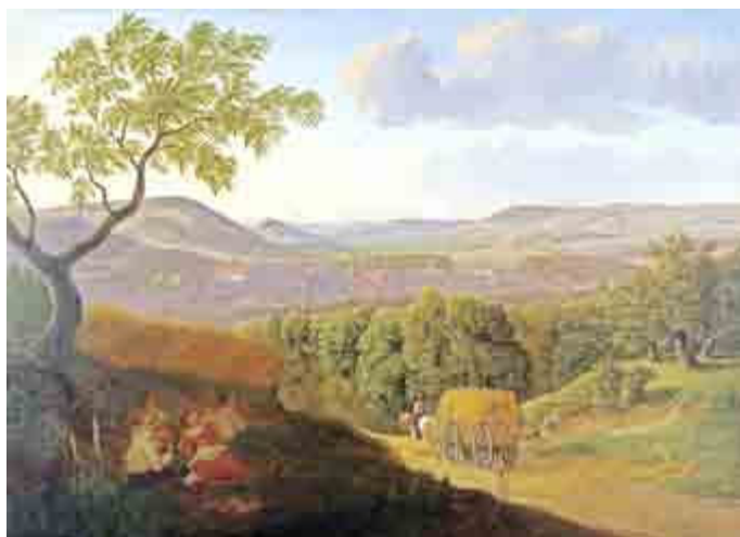
Ansicht von Meiningen 1832

3,50 / 2,50 €, Karten im Vorverkauf im Museumsshop im Schloss Elisabethenburg