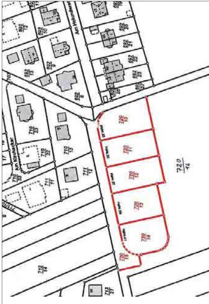
Maßstab ca. 1 : 2.000

zum Zweck der Wohnbebauung zur Eigennutzung zum Kaufpreis in Höhe von 90,00 €/m 2 .