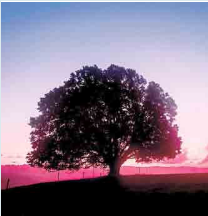
Lietebaum rotweißblau

Stadt - Nacht - Wald Fotografien von Falk Ziebarth 24.2. - 10.6. 2018 Vernissage: 24. Februar | 16:00