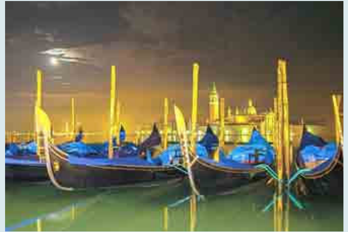
Venedig Gondeln, Foto: Ziebarth

„Stadt - Nacht - Wald“ lautet der Titel einer Ausstellung mit Fotografien von Falk Ziebarth die am 24. Februar um 16:00 Uhr eröffnet wird. Stadt, Nacht und Wald sind die Erfahrungsräume, aus denen der im hessischen Treischfeld lebende Fotograf seine Motive schöpft. Wenn es dunkel wird, begibt er sich auf die Suche nach dem Licht, im urbanen Raum und in der Natur. Weiterhin setzt er künstliches Licht ein. Die bevorzugte Technik der Langzeitbelichtungs fotografie bringt unerwartete und ästhetisch überraschende Ergebnisse hervor, die den Betrachter in Erstaunen versetzen. Es sind vor allem die dadurch entstehenden Verfremdungen und ungewohnten Blickwinkel auf die Objekte, die die Arbeiten von Falk Ziebarth auszeichnen. Die Motive bleiben in ihrer Ursprünglichkeit erhalten. Es wird nichts hinzugefügt oder weggelassen. Mit Bildbearbeitungsprogrammen verstärkt der Fotograf lediglich die gegebene Dynamik der Farben. Das verwendete Trägermaterial AluDibond bringt besonders die Nachtfotos zum Leuchten und verleiht schweren und großen Motiven Leichtigkeit. Der Hauptakteur auf den Arbeiten von Falk Ziebarth ist das Licht selbst. Mit natürlichen Lichtphänomenen aber auch mit künstlichen Lichtquellen gelingen dem Künstler außergewöhnliche Ansichten von Naturobjekten, Gebäuden und Stadtansichten.