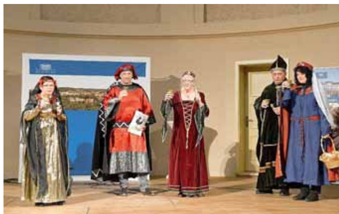
Der Club Henneberg e.V. spielte eine Episode aus der langen gemeinsamen Geschichte von Meiningen und Henneberg.