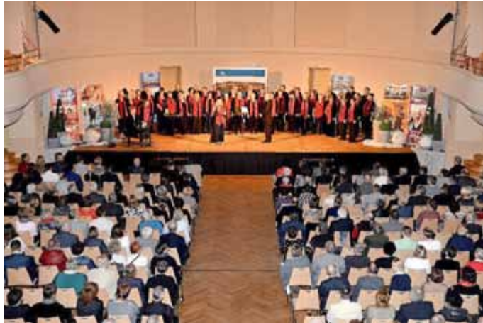
Eröffnet wurde der festliche Abend von der Chorgemeinschaft Cantamus der Musikschulen Meiningen und Hildburghausen.

Gemeinsam mit über 500 Vertretern aus Ehrenamt, Wirtschaft und Politik hat die Stadt Meiningen am 31. Januar 2019 ihren Zusammenschluss mit Walldorf, Wallbach und Henneberg gefeiert.