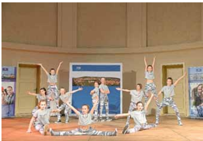
Die Bühnenflöhe aus Walldorf mit ihrem diesjährigen Premierenauftritt im karnevalistischen Showtanz.