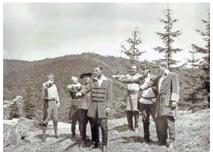
Georgs Enkel: Die Räuber, Steinb-Langenb. 1960er; Meiningener Museen