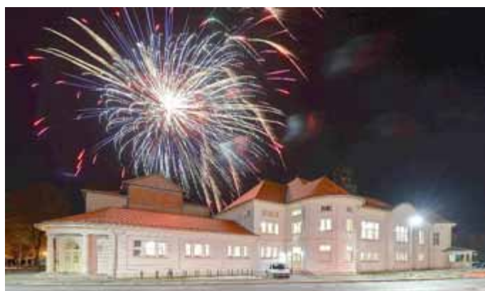
Mit einem Feuerwerk beschloss die Stadt Meiningen ihren Jahresempfang im Meiningener Volkshaus.