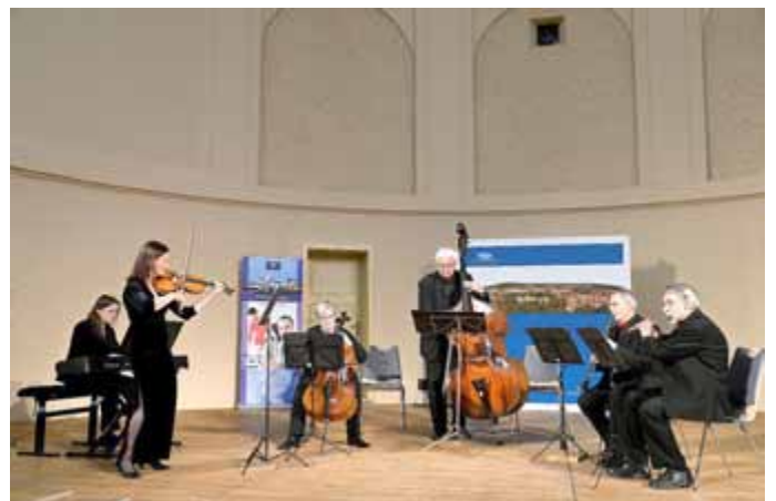
Meininger Salonorchesters Melange