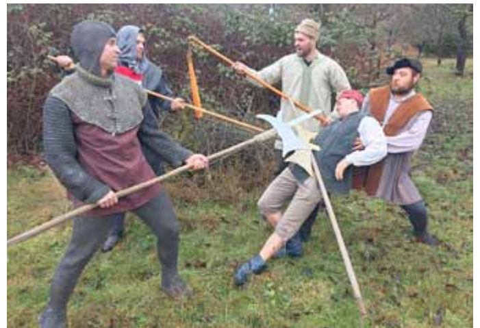
Die Stimmung ist gut. Die Jungs geben ihr Letztes.