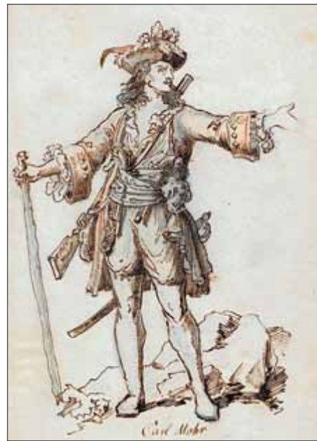
Georgs Enkel: Georg II., Die Räuber, Figurine Karl Moor; Meiningener Museen