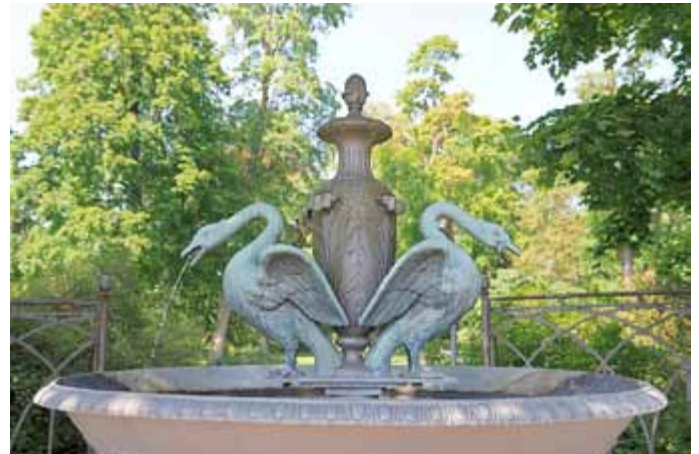
Schwanenbrunnen Meiningen; ed