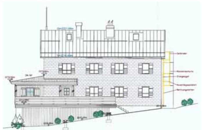
(West- und Süd Ansicht)

Also wurde gesprochen , gegrübelt und das Projekt „Hüttensanierung“ auf den Weg gebracht. Überlegungen dazu gibt es übrigens bereits seit Jahren, nicht unwesentlich beeinflusst durch einen Meiningener, dem ehemaligen Hüttenwart Frank Baumann. Nunmehr liegen die Entwürfe vor. Der Gastraum soll dabei durch Überbauung der jetzigen Terrasse erweitert werden und dann gesamt 88 Sitzplätze bieten. Mittels Holzbauweise ist vorgesehen an der Talschlussseite eine neue größere